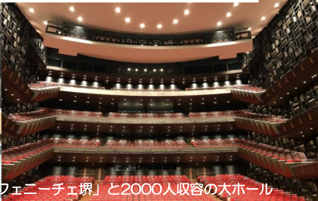
この秋にグランドオープンする堺市民芸術文化ホール「フェニーチェ堺」と2000人収容の大ホール

2019年8月23日（金）、24日（土）に堺市産業振興センターで「次代の自治を創る力～自由・自治都市 堺から～」をテーマに開催される全国自治体政策研究交流会議と自治体学会堺大会に向けて、開催自治体関係者と参加を予定する自治体学会会員の機運を盛り上げるため、プレ大会を開催します。若手2人の発表者を含む魅力的な出演者を迎え、地域づくりの新たな可能性を探ります。本大会の下見がてら、是非お越しください。終了後には、会場近くで情報交換会を行いますのでこちらもお楽しみ！