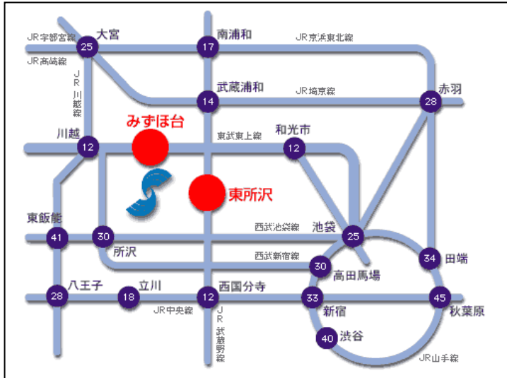
【みずほ台、東所沢へのアクセス図】